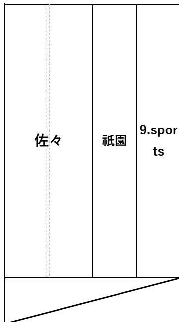
新スタンド（ゴール側）