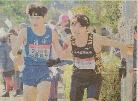
第1日1区中野(清峰高)を走る佐世保(左)と長崎国際大(へたすきりし)の選手(右)。(西彼時津町)